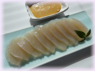
芦川町名産 刺身こんにゃく 450円