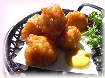
一口さつま揚げ 600円