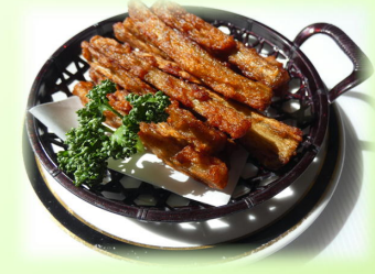
ピリ辛ごぼう揚げ 650円