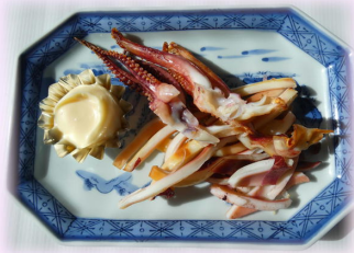
イカの一晩干し 700円